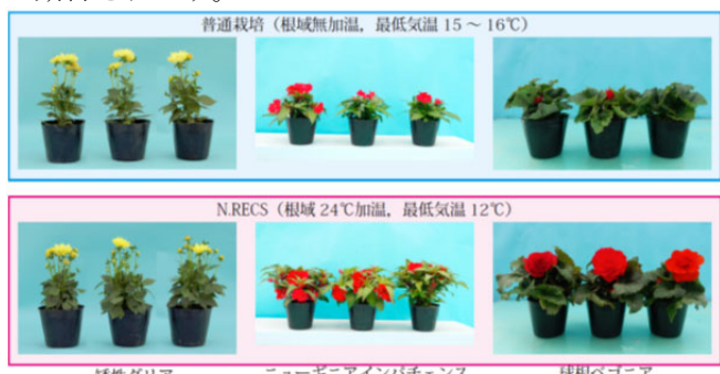
図4 冬季の根域加温が花の生育に及ぼす影響